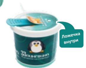
Стаканчик (100 мл)

Мороженое продается в удобной упаковке, которую приятно взять с собой.