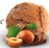
ЛЕСНОЙ ОРЕХ В МОЛОЧНОМ ШОКОЛАДЕ шоколадное с лесным фундуком