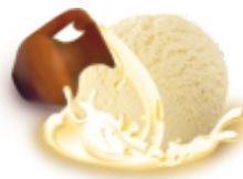
ПЛОМБИР НА СЛИВОЧКАХ пломбир классический на свежих сливках