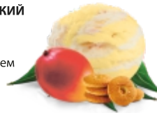
БРАЗИЛЬСКИЙ ДЕСЕРТ С МАНГО творожное с кусочками бисквита и конфитюром топпингом из манго и кусочками нежного бисквита