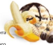
БАНАН В ШОКОЛАДЕ сливочное с банановым пюре шоколадным кремом