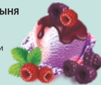
МАЛИНА-ЕЖЕВИКА двухслойное ягодное "малина" и "ежевика" с кусочками натуральных ягод