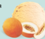
НЕЖНАЯ ДЫНЯ сливочное с пюре и кусочками дыни