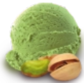
ФИСТАШКОВОЕ с кусочками обжаренной фисташки