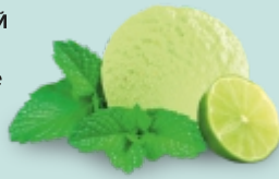
МОХИТО "мохито" с конфитюром из лайма