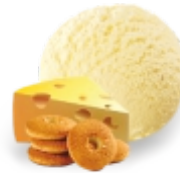
ФИЛАДЕЛЬФИЯ сырное с хрустящим печеньем