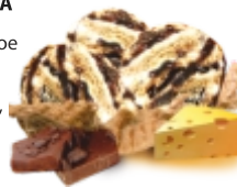
ЧИКАГО пломбир "молочный шоколад" и "сливочный сыр" с шоколадным кремом