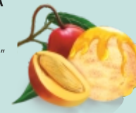
МАНГО-МАНГО манговое с кусочками манго конфитюром из манго