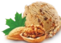
КЛЕНОВЫЙ СИРОП С ГРЕЦКИМ ОРЕХОМ пломбир с грецким орехом и кленовым сиропом