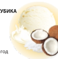
РАФАЭЛИНО сливочное с кокосом и миндалем