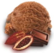
ТЁМНЫЙ ШОКОЛАД классический пломбир "тёмный шоколад"