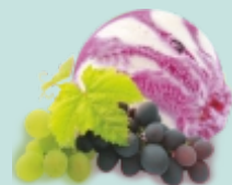
ИСПАНСКИЙ ВИНОГРАД двухслойное с красным и белым виноградом