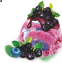
ЧЕРНИКА-ГОЛУБИКА двухслойное ягодное "черника" и "голубика" с кусочками натуральных ягод