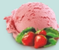
КЛУБНИЧНАЯ ПОЛЯНА клубничное с тертой клубникой