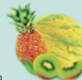
КАРИБСКИЙ АНАНАС фруктовое с мякотью и кусочками ананаса и конфитюром из киви