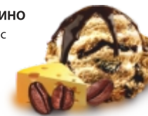
СИЦИЛИЯ пломбир кофейный и сырный с шоколадным кремом