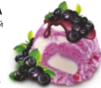
ЙОГУРТ-ЛАЙТ С ЧЕРНИКОЙ сливочно-йогуртное с черничным конфитюром