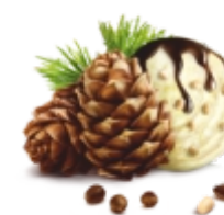
ПИНОЛАТТА классический пломбир с цельным кедровым орехом и шоколадным соусом