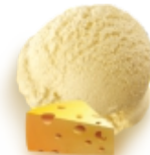
ШВЕЙЦАРСКИЙ ЛАНЧ пломбир с добавлением сливочного сыра