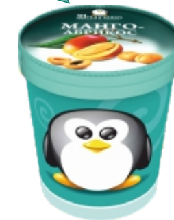
Ведро (500 мл)