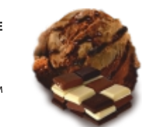
ТРОЙНОЙ ШОКОЛАД пломбир "молочный шоколад", "тёмный шоколад", с шоколадным кремом