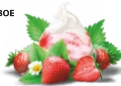
ТВОРОЖНЫЙ ДЕСЕРТ С КЛУБНИКОЙ творожное с клубничным конфитюром