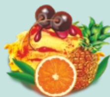
ЭКЗОТИК фруктовое с мякотью апельсина, кусочками ананаса и вишневым конфитюром