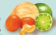
МАНДАРИН-ЛАЙМ двухслойное с мякотью и кусочками мандарина и лайма