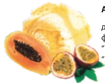
АМАЗОНКА двухслойное фруктовое "папайя" и "маракуйя"