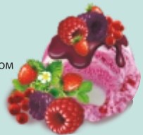
ЛЕТНЯЯ ПРОХЛАДА ягодное "лесные ягоды" и "клюква" с кусочками натуральных ягод