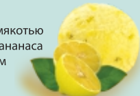
МЕКСИКАНСКИЙ ЛИМОН фруктовое с мякотью и кусочками лимона и лимонным конфитюром