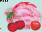
ВИШНЯ-ЧЕРЕШНЯ двухслойное фруктовое "вишня" и "черешня", с вишневым конфитюром